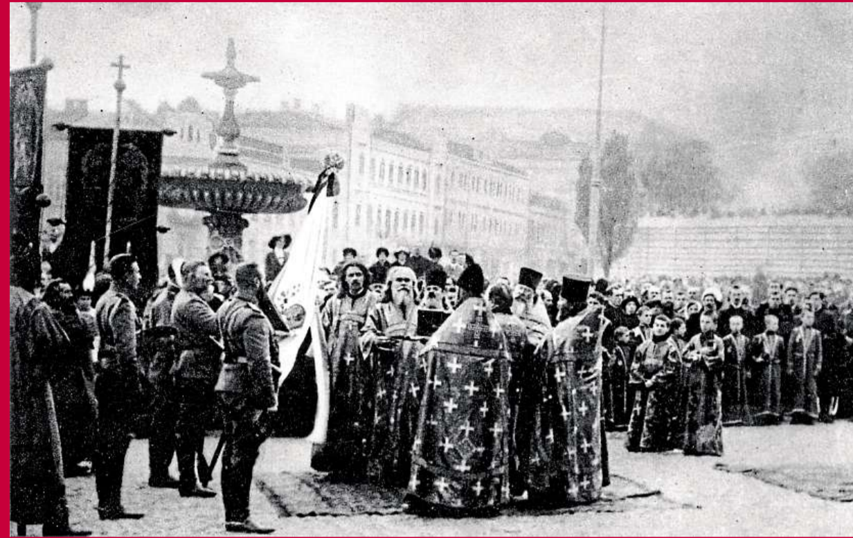
Svěcení praporu České družiny na Sofijském náměstí v Kyjevě 28. 9. 1914 zobrazuje snímek nahoře (podle současného kalendáře 11. 10. 1914).