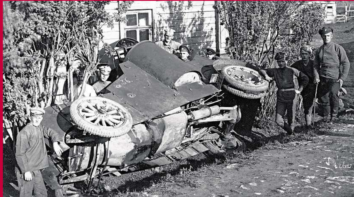
Bolševický obrněný automobil ukořistěný v boji u Lipjag, 4. června 1918