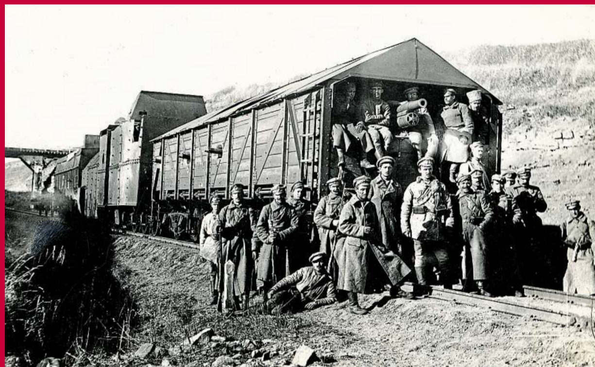
Jeden z mnoha čs. improvizovaných obrněných vlaků v Rusku, zde na frontě proti bolševikům severně od Jekatěrinburgu