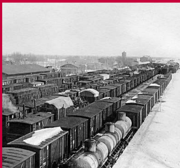
Vagony zrekvírované na Ukrajině sloužily jako pojiždná kasárna. Zde čs. vlaky v Čeljabinsku (1919).