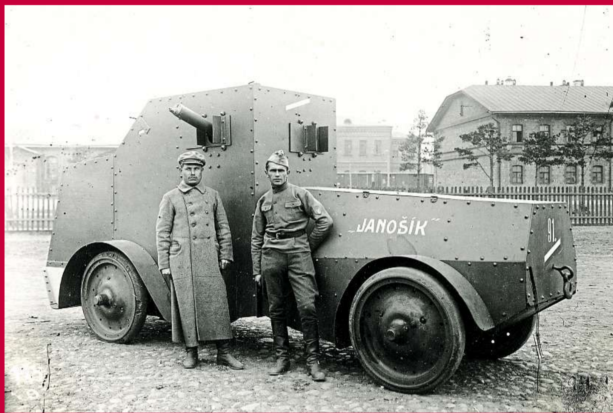
Obrněný automobil Janošik, nasazený proti bolševikům na řece Maně na Sibiři